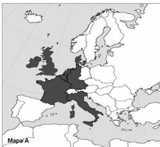
Mapa A. ....

Mapy przedstawiają proces rozwoju terytorialnego Unii (Wspólnot) Europejskiej. Do zamieszczonych map dobierz odpowiadające im tytuły. W wyznaczone miejsca wpisz właściwe numery.