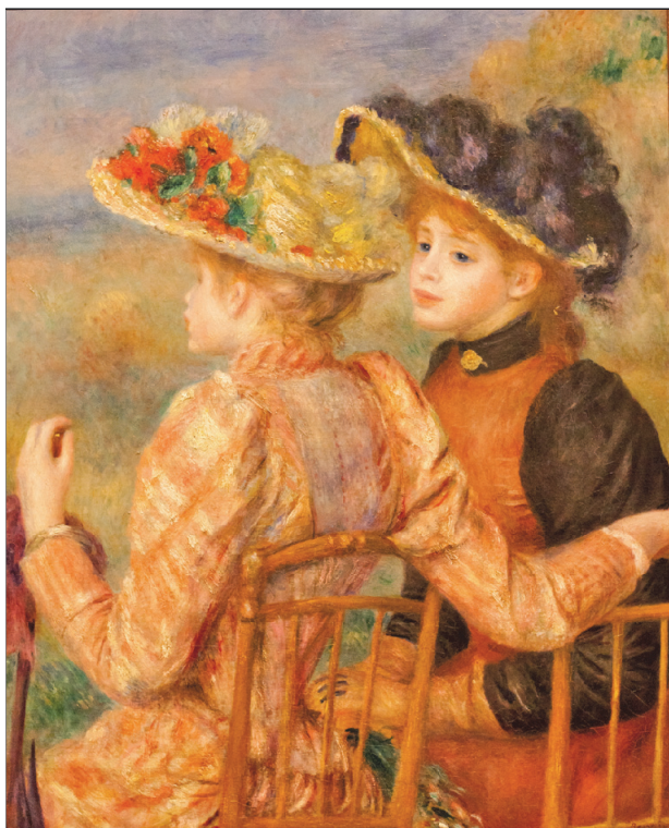
Pierre-Auguste Renoir Dwoje dziewcząt , 1892 r. olej na płótnie Muzeum Sztuki, Filadelfia