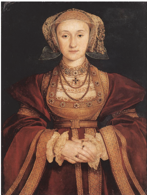
Hans Holbein Anna Cleves , ok. 1539 r. akwarela na pergaminie przeklejona na płótno Luwr, Paryż